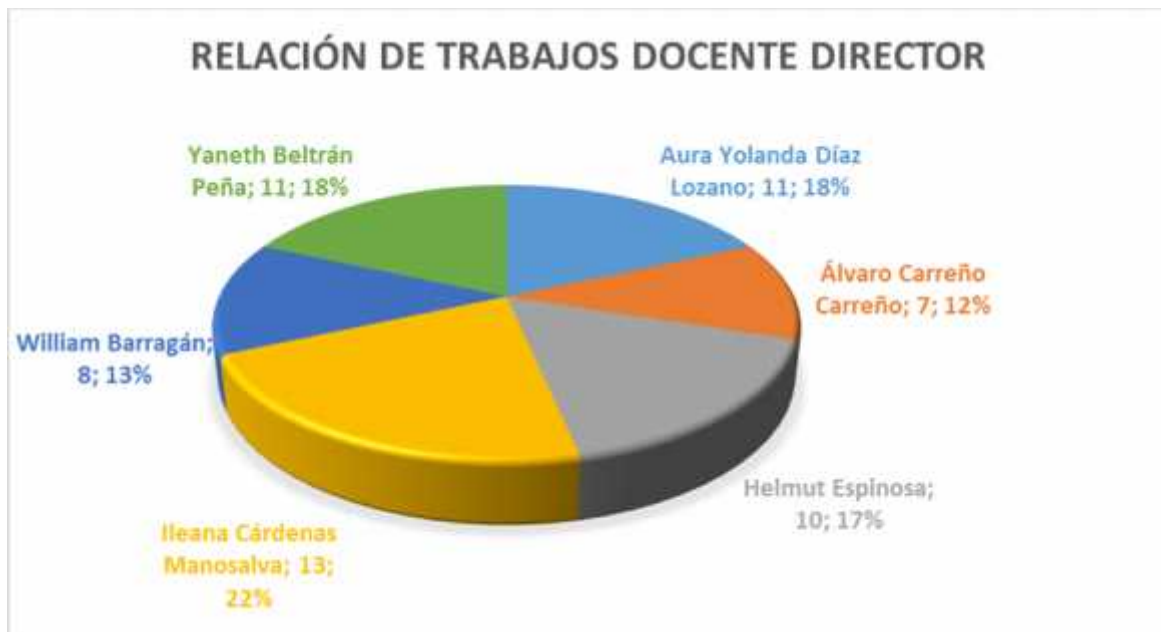
Gráfico 4 – Relación de Trabajos Asignados a Docentes Directores