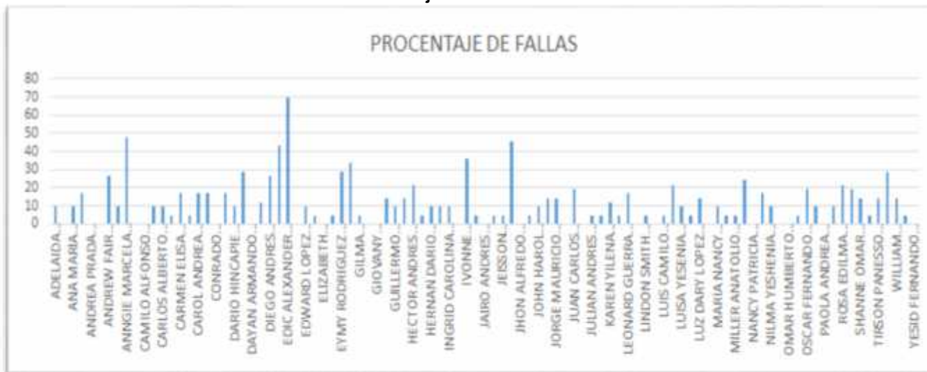
Gráfico 3 - Porcentaje de Fallas

El porcentaje de fallas ponderado del curso fue del 11,5%. En el gráfico 3 se muestra el porcentaje total de fallas, observando el valor más alto correspondiente al 69.6%, seguido del 48%. De manera global, la inasistencia que se presentó fue baja con casos de 0% y de 4.8% los cuales representaron aproximadamente la mitad del curso.