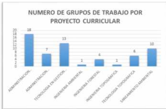
Gráfico 2 - Número de Grupos de Trabajo por Proyecto Curricular

Página 16 de 42 ACTA No. 004 REUNIÓN ORDINARIO DEL CONSEJO DE FACULTAD FECHA: 18 DE FEBRERO DE 2016 HORA: 8:00 A.M. LUGAR: SALA DE JUNTAS SEDE CALLE 134